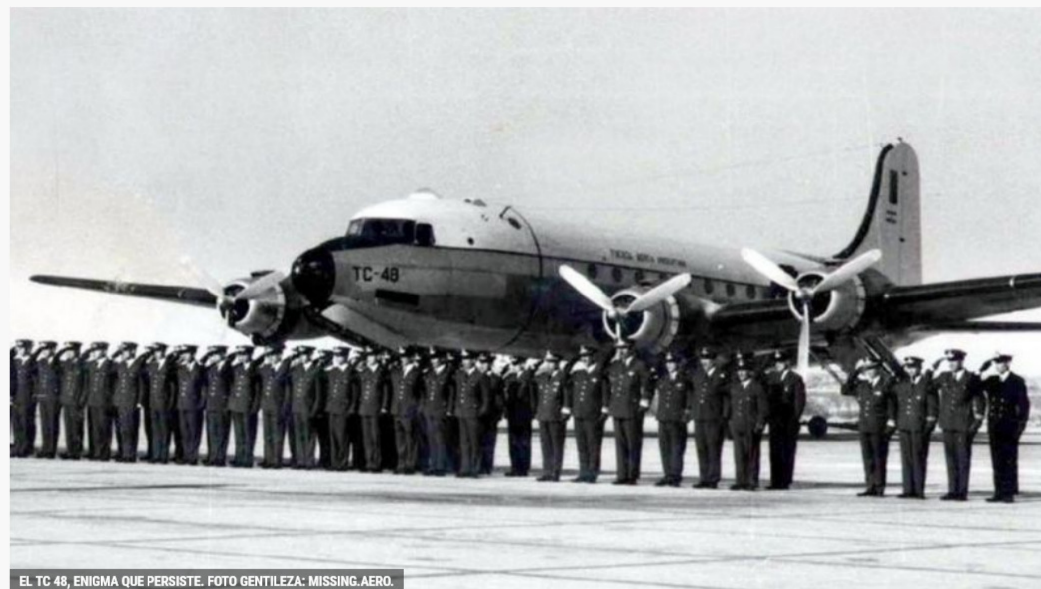
EL TC 48, ENIGMA QUE PERSISTE.

La búsqueda del avión TC-48 de la Fuerza Aérea de nuestro país, extraviado en 1965 en Costa Rica con 68 personas a bordo, será reanudada por estas horas.